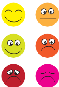
B: Kommentarkort – holdning